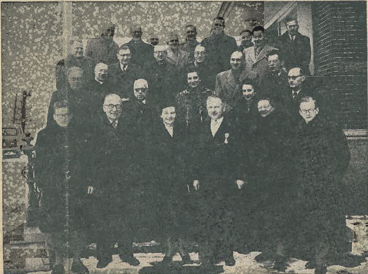
De pasbenoemde Officier, temidden van familie, directie, officials en employés, onmiddellijk na de plechtige uitreiking van het Erekrus.

Met deze wens eindigde een bijeenkomst, welke juist door haar spontaniteit getuigde van groot respect voor wat enorme werkkraft en doorzettingsvermogen, naast breed sociaal inzicht vermochten te bereiken.