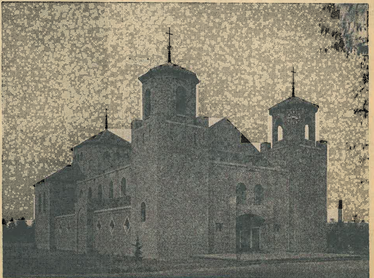
De St. Josephkerk van Dorplein.