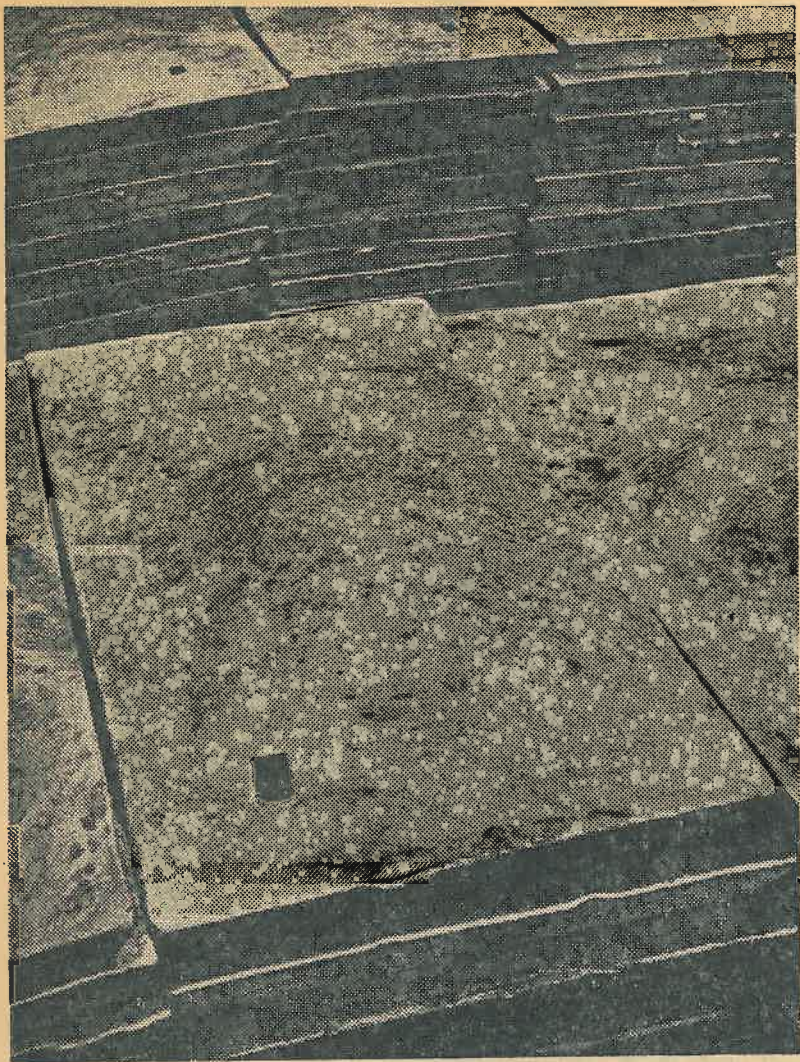
En dit zijn nu „lingots” of zinkblokken, waaraan ons blad zijn naam ontleende.