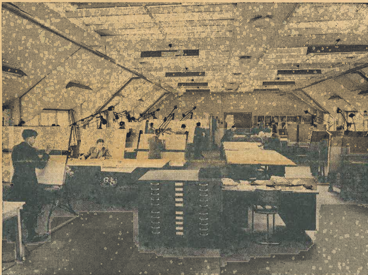
Een kijkje in de tekenkamer.

En de mensen moesten toch wonen? In den beginne vooral de vaklieden, meegebracht uit Wallonië, later ook het personeel, dat hier werd opgeleid. Welnu; men bouwde een compleet dorp en het duurde niet lang of dit dorp — ons Dorplein — kreeg een gezellenhuis, in de wandeling „Cantine“ genoemd, waar zowel employé's als arbeiders aan een goede zorgen van Franse Zusters (het merendeel van de eerste bewoners was van Waalse origine) werd toevertrouwd. Deze „Cantine“ omvatte reeds toen, het goed-geaccmodeerde pension, met eigen wasserij, bakkerij, biljartzaal, ziekenzaal, een kapel en een grote ontspanningszaal, welke, naar smaak en opvatting van die tijd, tot ver over de landsgrenzen geremd werd als hoogst modern. En terecht.