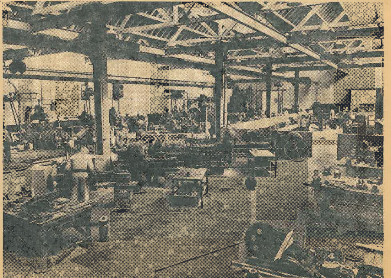
Een blik in de Reparatie-werkplaats K.Z.M.

Het ontstane zwavelzuur is een vloeistof en slaat neer tegen de kamerswanden en regent op de bodem van de kamer welke als vergaarbak is uit-