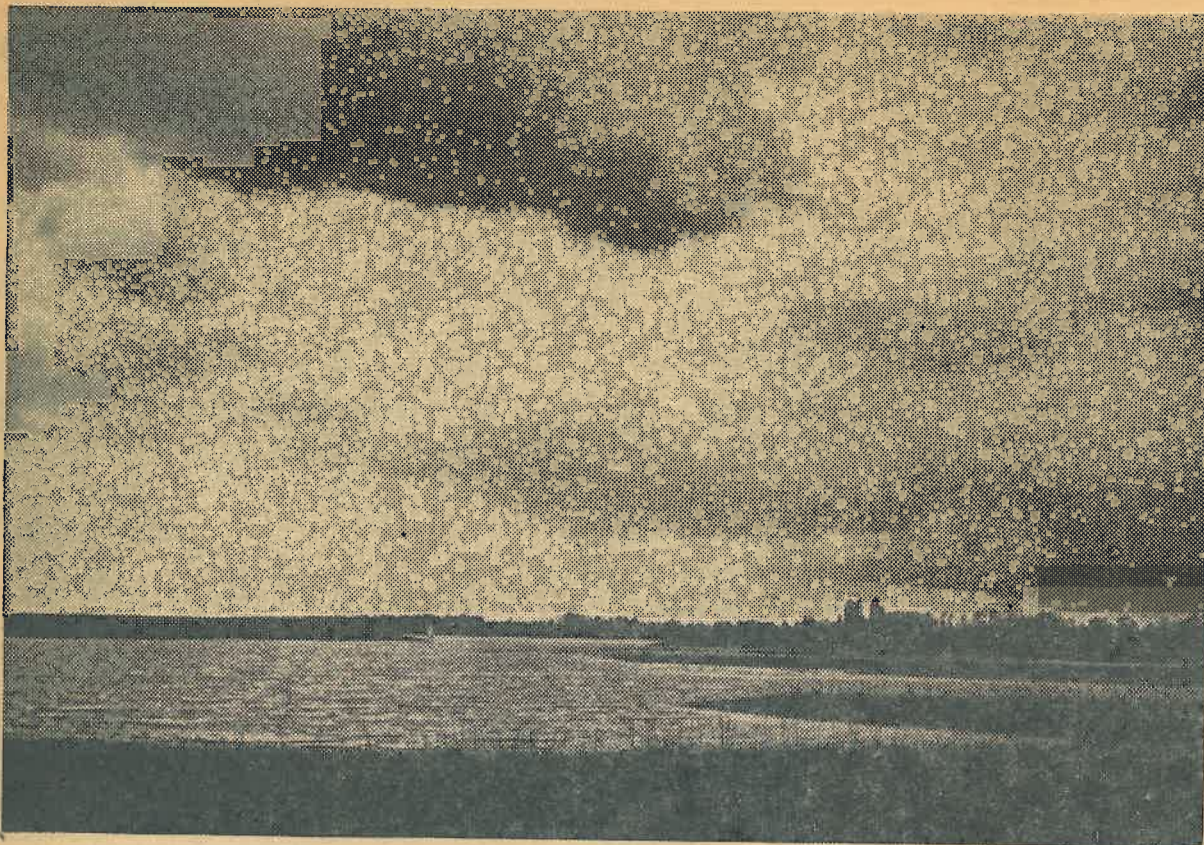
Ergens aan het Ringselven.