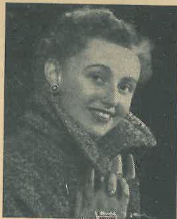
De eerste K.Z.M.-jubilarisse:

Op deze manier worden ze niet vergeten en vergeten ze ons niet. Het is immers een van de eerste behoeften van de mens: het besef te hebben in een (werk)gemeenschap te zijn opgenomen, waar je meetelt!