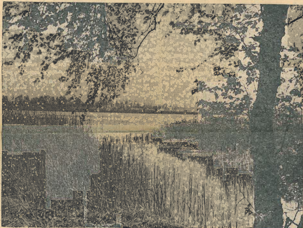
Het wordt weer Lente aan het Ringselven.