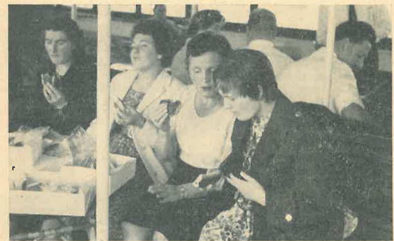
Het smaakte best....

op reis gaat een z.g. formulier E.6 af te halen bij het ziekenfonds loket 1 of 5. Hebt U in het buitenland onmiddellijk geneeskundige hulp nodig, dan moet U zich met Uw ziekenfondskaart en formulier E.6 wenden tot het in Uw tijdelijke verblijfplaats werkend orgaan der ziekteverzekering. Dit is: In België de Gewestelijke Dienst van de Hulpkas voor ziekte en invaliditeitsverzekering. In W.-Duitsland de Algemene Ortskrankenkas van de Land Krankenkasse c.q. de Kreis-Verzicherungs Anstalt. In Frankrijk de Caisse primaire de securité sociale. In Italië de provinciale zetel van het Istituto Nazionale per L'Assicurazione contro le malattie (I.N.A.M.) In Luxemburg de caisse regionale de maladie. Het desbetreffende orgaan verstrekt de geneeskundige verzorging overeenkomstig de wetgeving van het land van tijdelijk verblijf. Alleen ten aanzien van W.-Duitsland bestaat zekerheid dat nagenoeg geen kosten voor rekening van de patiënt komen, in de andere landen dient men rekening te houden met de mogelijkheid, dat min of meer belangrijke bedragen te zijnen laste blijven. Met nadruk wordt er nog op gewezen, dat de verzekerden in beginsel geen enkel recht kunnen doen gelden indien zij zich niet nog gedurende hun verblijf in een der genoemde landen hebben gewend tot het orgaan dat werkzaam is ter plaatse waar zij tijdelijk verblijven.