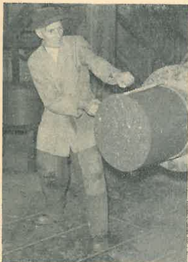
A. Fransen Retortenfabricage

De jaarlijkse huldiging van bedrijfsgegoten, die in de loop van dit jaar hun 40- en 25-jarig dienstverband bereikten, zal plaats hebben op woensdag 21 december a.s. in het Ontspanningsgebouw.