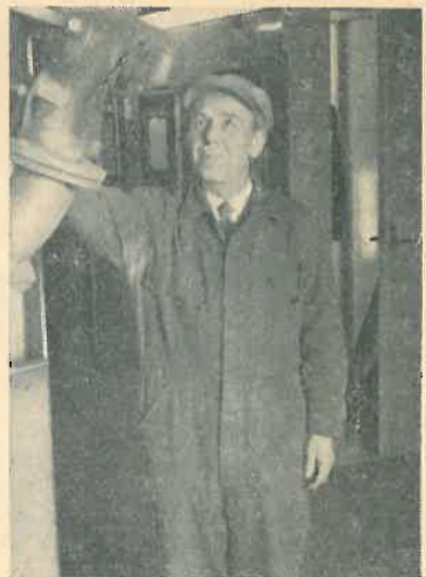
L. Peeters Voorman wervelovens