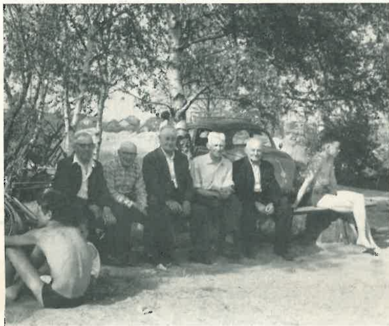
Ook onze bejaarden amuseren zich best aan het Ringselven... Als het maar goed weer wil zijn!

Als alles goed gaat zal onze school op 21 augustus weer 8 leerlingen rijker zijn.