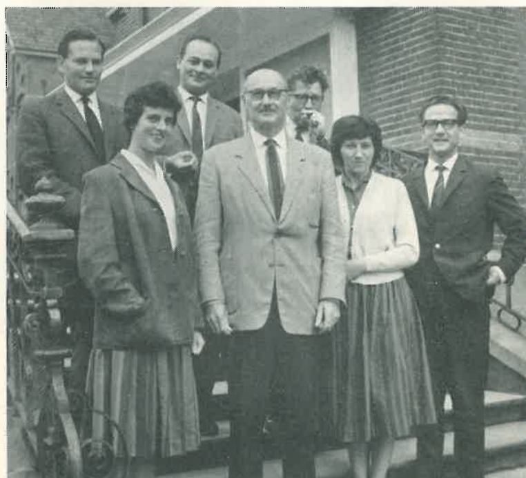
Een van de groepen excursisten, die in de laatste weken onze fabriek bezochten; hierboven een groep leraren van het Bisschoppelijk College te Weert