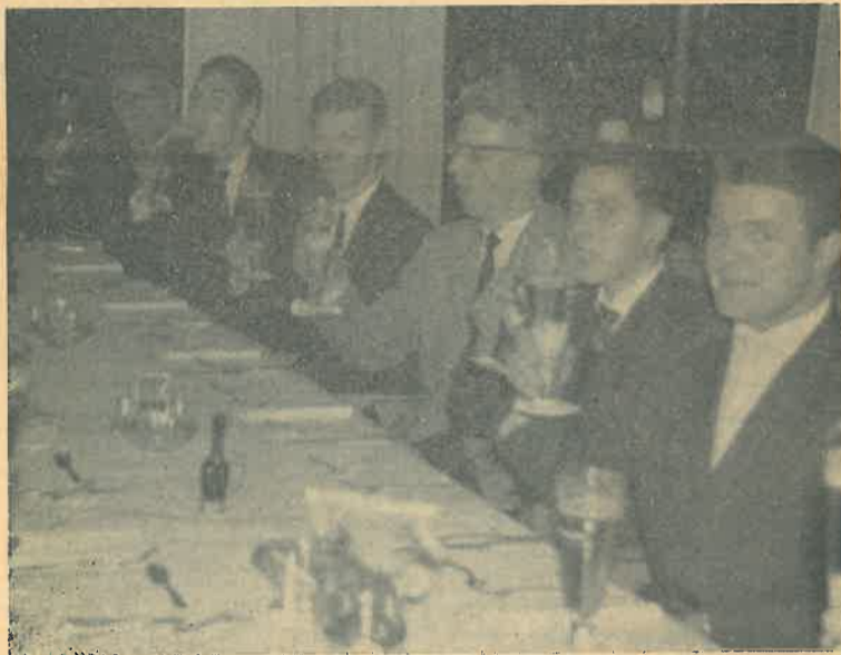
Het slot van de trip

In de beste stemming werd de terugtocht aanvaard en arriveerden we in onze woonplaatsen, maar niet nadat we ook onderweg nog hier en daar 'gepleisterd' hadden.