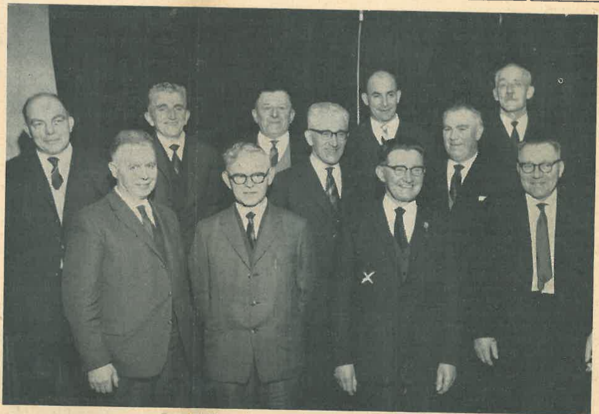
DE ELF JUBILARISSEN VAN 1962

Als dan tevens ook nog de tuinarchitect zijn werk gedaan heeft, hoeft men er niet aan te twifelen, dat de Dorpleinse jeugd een school heeft waarop zij, maar niet minder de ouders, trots kan zijn.