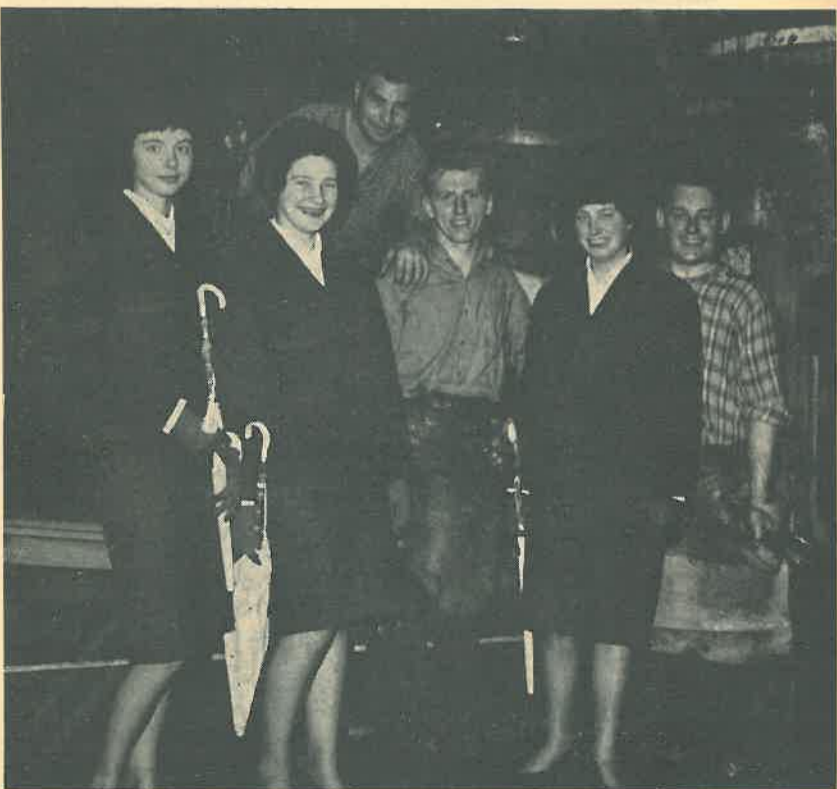
Op 3 april bracht de Brabantse K.V.P.-ploeg (kamerleden, leden van Provinciale Staten) o.a. vergezeld van een drietal „K.V.P.-ambasadrices” een bezoek aan ons bedrijf. Een groepje pletters liet zich de kans niet ontglippen om zich met deze jonge dames te laten vereeuwigen.