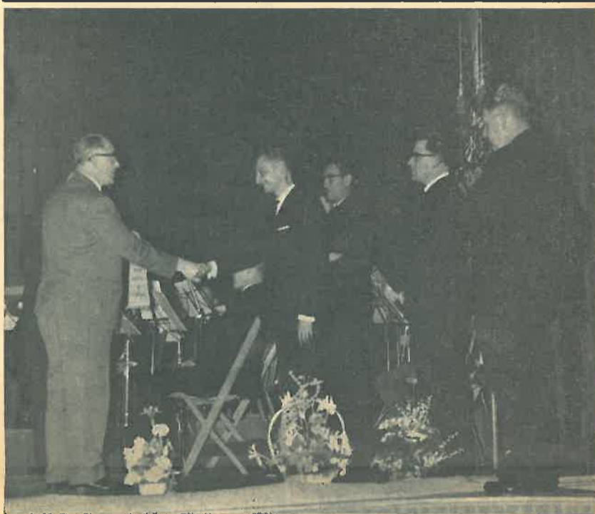
Hierboven een moment tijdens de plechtige uitreiking van de kampioenswimpel, op 17 mei j.l. uitgereikt aan „Les Echos de Dorplein” vanwege de Bossche Federatie van Muziekgezelschappen.

Deze spaarregeling treedt in werking op 8 mei 1963. Zij strekt tot aanvulling van de winstdeling K.Z.M. Budel en wordt geacht daarvan deel uit te maken.