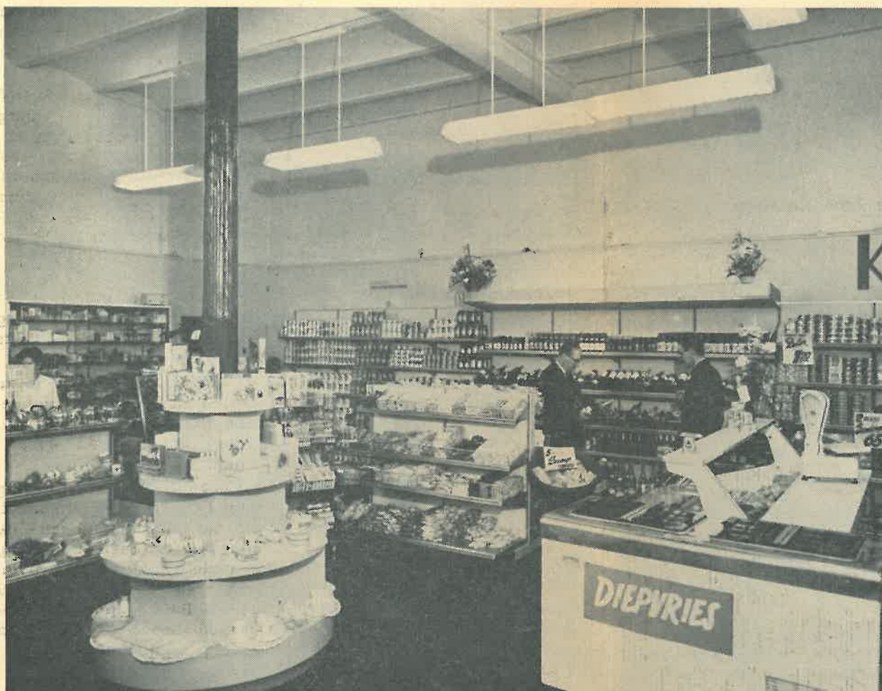
Een kijkje in de geheel tot zelfbedieningszaak omgebouwd e coöperatieve winkel te Dorplein.

De gloed van onze laatste „open” oven is echter symbolisch bewaard gebleven daar op de bewuste zaterdagmorgen oven 15 door ir. Hoyer werd aangestoken met het vuur van een van de vlammetjes uit de tippen van oven 17. Dus toch nog een beetje... romantiek.