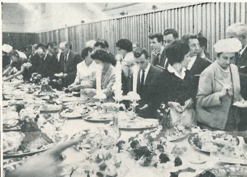
...en er werd h el democratisch en h el veel en h el lekker gegeten...

Voorwaar een gebeurtenis die niet snel vergeten zal worden en waar de initiatiefnemer, directeur Delhaise alle eer mee heeft ingelegd.